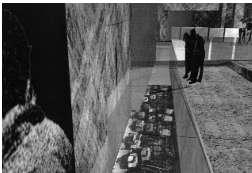
São Paulo 2030 – Die Brücke der Sicherheit: Zu Beginn des 21. Jahrhunderts erstickte São Paulo im Verkehr. Die Bewohner litten unter Gesundheitsproblemen.

Auf der Ebene betritt der Besucher eine futuristische archäologische Ausgrabungsstätte, die die unterirdischen Versorgungsnetze in Städten wie São Paulo sichtbar machen. Das Prinzip der Nachhaltigkeit wird durch eine transparente Oberfläche gezeigt, durch die man Ströme von Wasser, Ab-