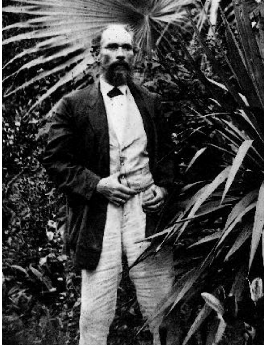
Dr. Hermann Blumenau in seinem selbst angelegten Garten in Blumenau, 1861.