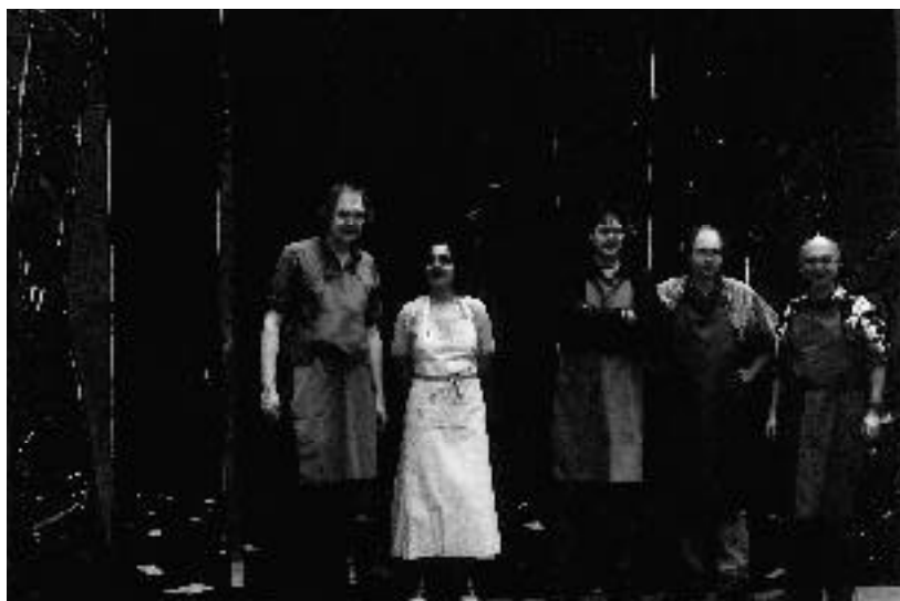
Die Hamburger Künstler, nachdem ihr Holzschnitt durch Blau-Färben sichtbar geworden ist.

Wäre es dem Welt-Jahrtausend-Mann Gutenberg vergönnt gewesen, die ihm dargebrachte außergewöhnliche Huldigung leibhaftig entgegenzunehmen, so hätte er sie möglicherweise mit einem abgewandelten Wort seines fast ebenso berühmten Nachbarn und Namensvetters Goethe kommentiert: „Dieser Farbholzschnitt ist ja ein Gleichnis! Ein Happening“ – hier wurd’s Ereignis!“ ■