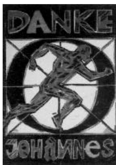
Die Hauptfigur Johannes Gutenberg – auf drei Bahnen Seide gedruckt.