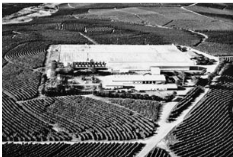
Luftbild der Fazenda Conquista mit Verwaltungsgebäude. Die Fazenda Conquista im Bundesland Minas praktiziert Öko-Effizienz vom Saatgut bis zur Verpackung des Kaffees.

Pflanzungen in anderen Teilen von Minas gehören, mit einer einzigen Lese durch. Bei insgesamt 11 Millionen abzupflückenden Stauden hilft das enorm Kosten sparen, auch wenn ein Teil der Arbeit