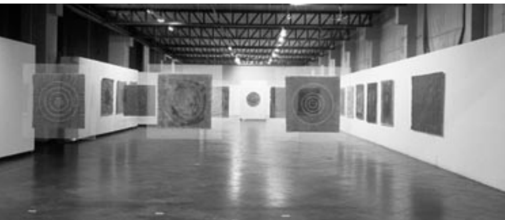
Exposição de Gustavo da Liña na Usina do Gasômetro, Porto Alegre/RS, Brasil, outubro/2002.