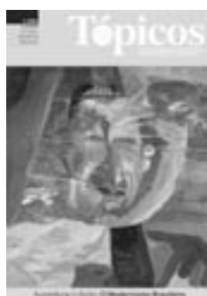
1 | 2004