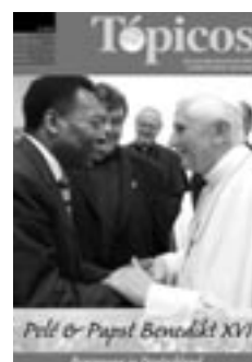
2 | 2005