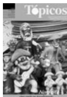
1 | 2005