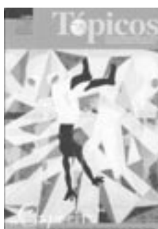
2 | 2004