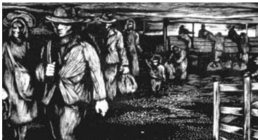
Os Retirantes, Renina Katz, 1948/56, linoleogravura

Andrade, Flávio de Carvalho e Mário Pedrosa, e influenciou importantes gravadores no Brasil. O interesse dos críticos e dos artistas era o mesmo: apreender as qualidades da artista alemã e expandir as possibilidades da produção brasileira, às voltas também com o homem e o mundo turbulento do século XX. ■