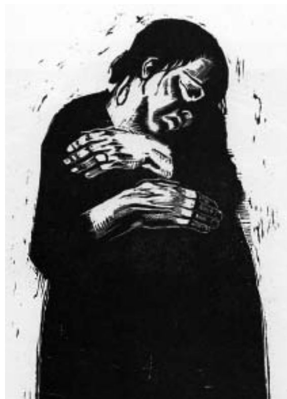
A Viúva I, Käthe Kollwitz, 1922/23, xilogravura (obra que foi comprada por Mário de Andrade e hoje se encontra na coleção do IEB (Inst. de Estudos Brasileiros))

Após 1945, com o final da II Guerra Mundial e a restauração da democracia no Brasil, surgiu uma segunda geração de artistas gráficos. Tratava-se de artistas figurativos, que constituíam uma espécie de resistência à onda internacionalista abstrata que vinha se impondo na arte brasileira no final da década de 40. Ao caráter apolítico e neutro do abstracionismo, estes jovens artistas antepunham uma arte engajada com forte caráter crítico-social e tendências realistas.