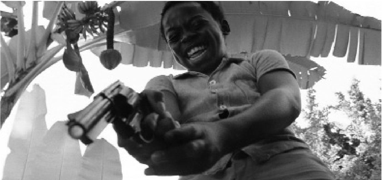
Szene aus dem Film Cidade de Deus

trotz eines drastisch gekürzten Kulturetats, die nationale Filmindustrie anzukurbeln.