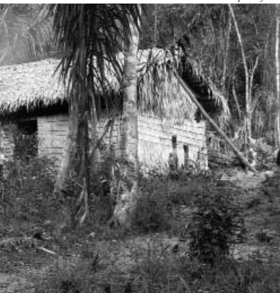
Siedler am Arapiunsfluss

sensibilisiert werden, um eine nachhaltige Entwicklung erreichen zu können. Diesen Prozess hat der DED in den letzten Jahren erfolgreich unterstützt. Einer der herausragenden sichtbaren Erfolge ist unser Engagement bei der Legalisierung der Schutzzone „Verde para Sempre“ in Porto de Moz.