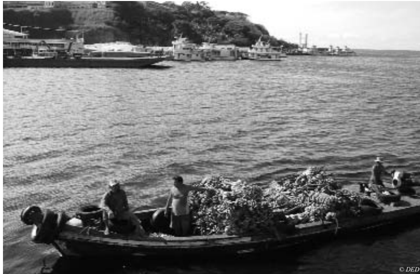
Bananentransport in Manaus: Der DED unterstützt Projekte im Amazonas

lungshilfe“ in der Vergangenheit verändert hat. Heute spricht man im Allgemeinen von Entwicklungszusammenarbeit und es geht immer mehr um „capacity-development“.