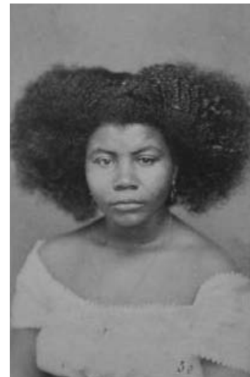
Mulatten-Mädchen aus Salvador, Provinz Bahia, um 1869

Wilhelm Reiss unternahm zusammen mit Alfons Stübel, auch einem Forschungsreisenden, zwischen 1868 und 1876 eine Reise nach Lateinamerika. Ziel war eine systematische Vermessung und Erkundung der geographischen Gegebenheiten. Von dieser Reise brachten sie eine große Anzahl von Fotografien mit, aus der dann einerseits die Sammlung Stübel im