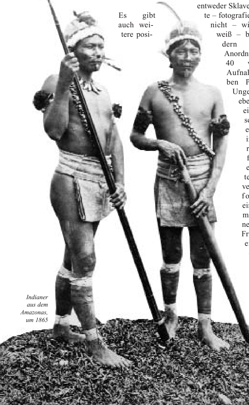
Indianer aus dem Amazonas, um 1865

Trotz des manchmal angebrachten kritischen Blicks auf die Ethno-Fotografie des 19. Jahrhunderts ist doch festzuhalten, dass wir ihr wesentliche Erkenntnisse über ein Land, seine Sitten und seine Geschichte verdanken. ■