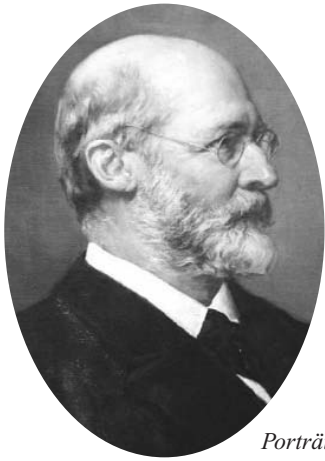
Porträt Wilhelm Reiss