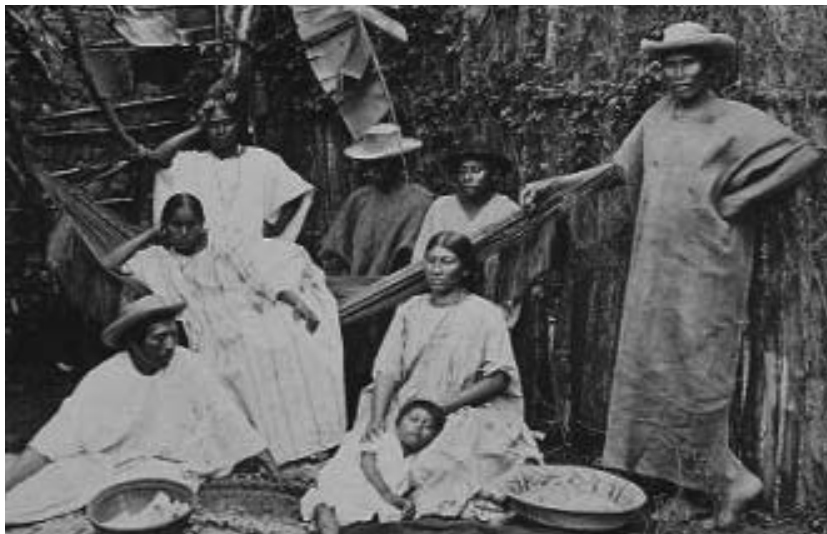
Bolivianische Fährmannsfamilie am Amazonas, Brasilien, Foto: Alberto Frisch, um 1865