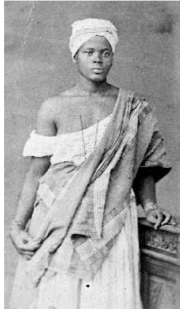
Einheimische Dienerin, Pernambuco, um 1865

Ungewöhnlich ist ebenfalls, dass er einen Einheimischen, wie z. B. einen Jungen, in einer legeren Haltung festhält, die eine entspannte Situation verrät. Oder er fotografierte eine junge Frau mit einer schönen malerischen Frisur in Form eines Herzens, die in einer mehr oder weniger herausfordernden u n d