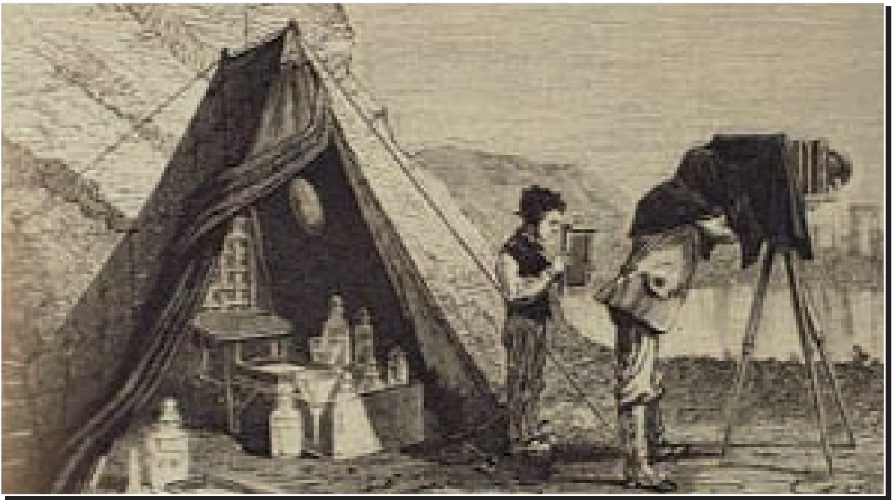
Ausrüstung eines Reisefotografen im 19. Jh.

So werden hier Berufsstände in einer gleichsam „sozialständischen Katalogisierung“ festgehalten, die den Menschen mit seinen Verkaufsprodukten und Arbeitsutensilien in einem Atelier zeigen. Ein subtiler Meister der Porträtkunst war der Fotograf Alberto Henschel (1827 – 1882), der die Einheimi-