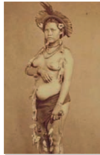
Indianer (die „edlen Wilden“) aus dem Amazonas, um 1865

schen in seinem Fotoatelier ablichtete. Bei den Dargestellten handelt es sich, wie Stübel vermerkt, um „Negertypen, die als Sklaven zumeist in Afrika geboren wurden“.