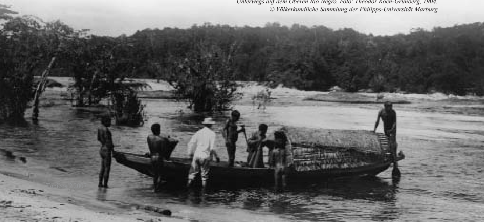
Unterwegs auf dem Oberen Rio Negro. Foto: Theodor Koch-Grünberg, 1904. © Völkerkundliche Sammlung der Philipps-Universität Marburg

Führungen für Gruppen nach telefonischer Vereinbarung (06401-2233280). Weitere Information finden sich unter: www.museum-im-spital-gruenberg.de .