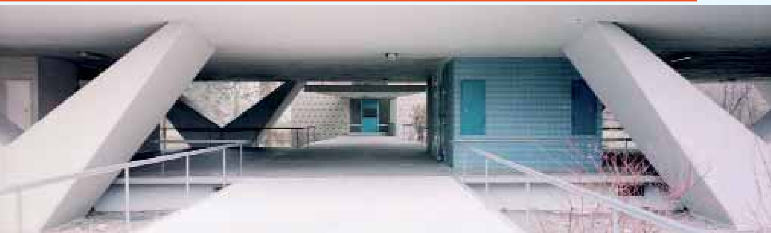
Eingang zum Niemeyer Haus im Berliner Hansaviertel

Ursprünglich erschienen in Die Zeit 4.4.2007