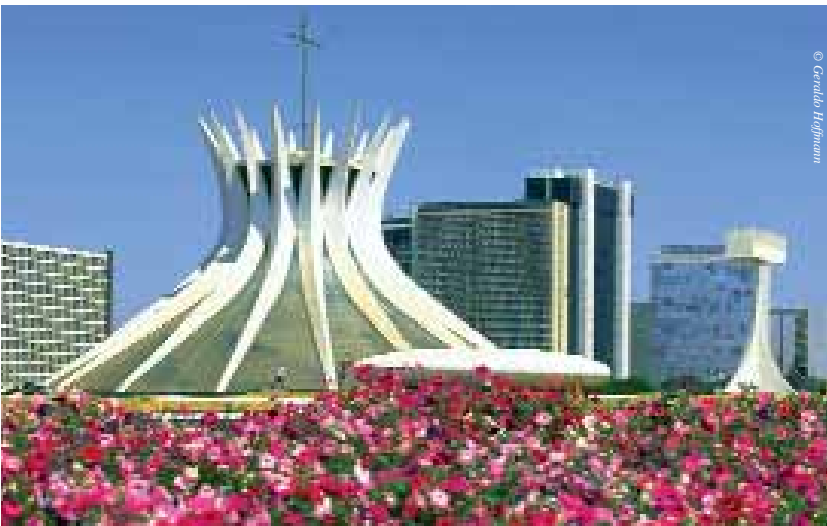
Niemeyers Handschrift: Die Kathedrale von Brasília...