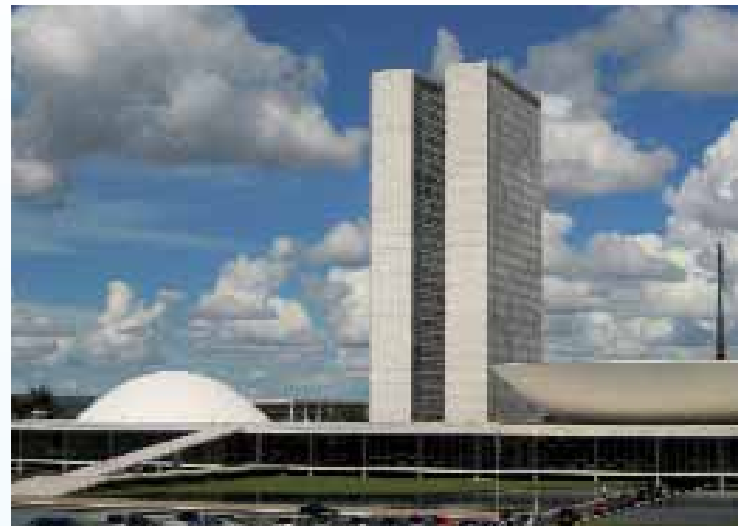
... und das Gebäude des Nationalkongresses

Aber wir hatten Feuer gefangen für diese Idee, und das ganze Land hat mit uns geträumt. Die neue Stadt sollte dem armen Landesinneren den Aufschwung bringen. Es sollte keine Slums geben, in den Wohnblocks sollte der Minister neben dem Chauffeur leben. Ich erinnere mich, wenn wir mit dem Auto diese endlosen Kilometer durch die Steppe fahren: Uns begegneten Lkw voller Bauarbeiter, die aus allen Teilen des Landes kamen! Sie wollten an Brasília mitarbeiten, sie dachten, dass sie dort Arbeit und ein glückliches Leben finden würden. Brasília erschien wie ein Versprechen, die Armut hinter sich zu lassen.