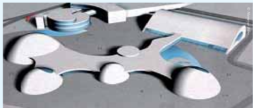
Skizze des Niemeyer Bades in Potsdam

Es ist ein Zeitvertreib, aber ich glaube, dass jede Universität jeden Studenten Philosophie lehren sollte, Geschichte und Literatur. Damit man nicht am eigenen Fachgebiet klebt. Man muss kein Intellektueller werden, aber man sollte sich eine weite Sicht der Welt aneignen. Mir hat man zum Beispiel im Laufe meiner Karriere mehrere Architekturpreise aberkannt, aufgrund meiner politischen Überzeugung. Das hat mich geärgert, aber