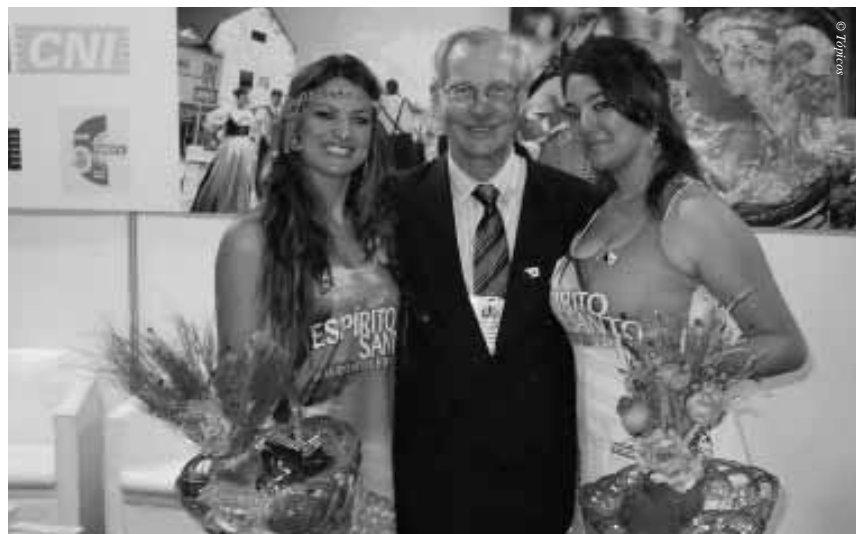
Charmante Werbung für Vitória / Espírito Santo 2009