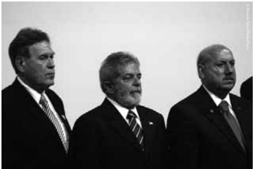
Bundeswirtschaftsminister Glos, Präsident Lula und Gouverneur Luiz Henrique

stitutionen, sowohl seitens des Staates als auch in Öffentlich-Privater-Partnerschaft mit Unternehmen des In- und Auslandes, sollen die Infrastruktur zügig erneuern und ausbauen: Häfen und Flughäfen, Straßen und Schienen, Trink- und Abwasser, Erzeugung und Überlandleitung elektrischer Energie. Auch die von der Kreditanstalt für Wiederaufbau finanzierte Studie über eine ICE-Verbindung Rio de Janeiro – São Paulo soll wieder auf den Tisch. Nicht zuletzt erwartet die brasilianische Regierung von der Fußball-Weltmeisterschaft 2014 einen Investitionschub, bei dem die deutsche Wirtschaft aufgrund ihrer Erfahrungen bei der WM 2006 hochwillkommen ist.