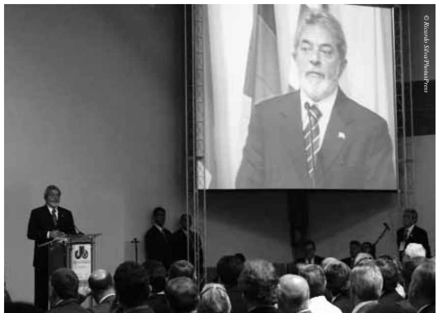
Präsident Lula vor dem Eröffnungsplenum

Planungsminister Paulo Bernardes stellte sodann das Programm zur Beschleunigung des Wirtschaftswachstums (PAC) vor, das der Präsident zum Flaggschiff seiner zweiten Amtszeit gemacht hat. Massive Inve-