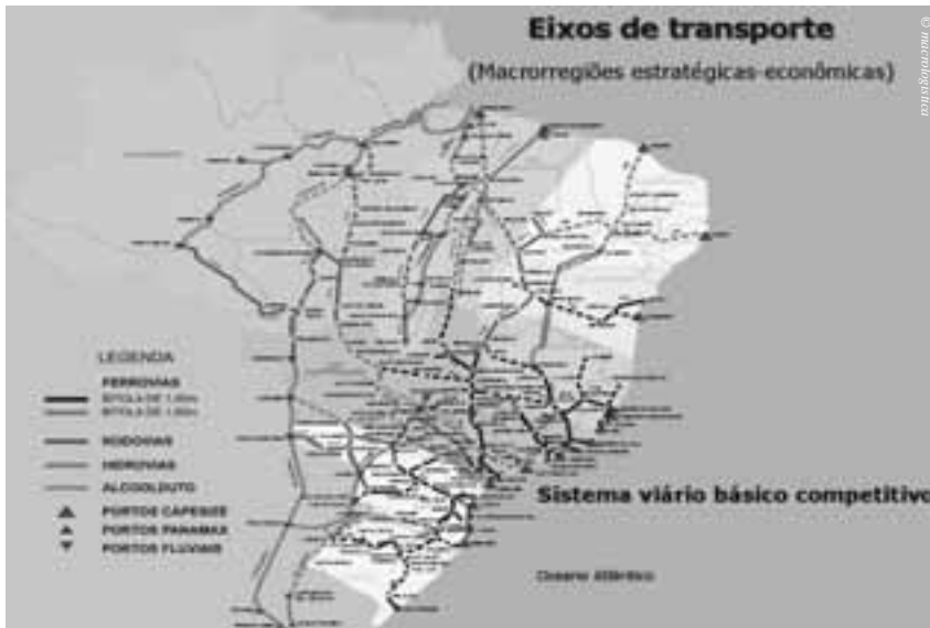
PAC: ein ehrgeiziges und umfassendes Infrastrukturprogramm

Viele der aus Deutschland angereisten Unternehmensvertreter und ihre brasilianischen Partner nahmen außer den Ermutigungen von Präsident Lula auch konkrete „Hausaufgaben“ mit.