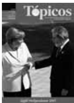
2 | 2007