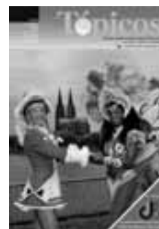
2 | 2008