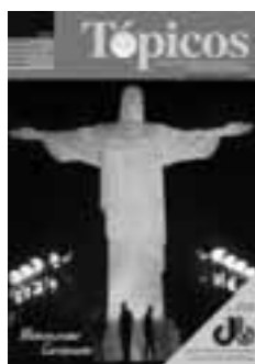
3 | 2007