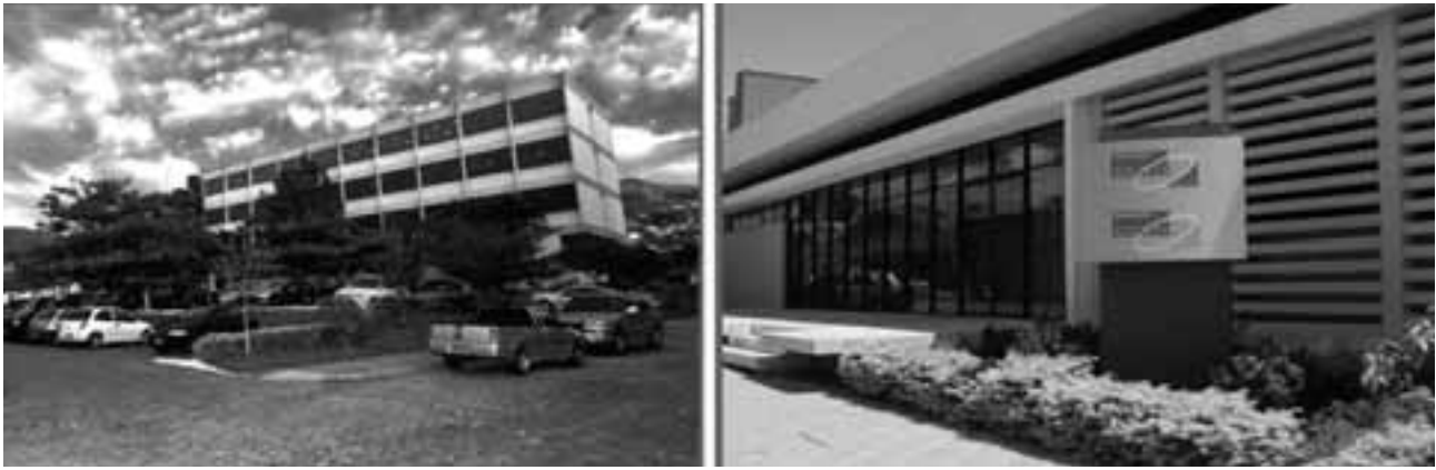
Figura 2: Sede da Fundação CERTI no Campus da Universidade Federal de Santa Catarina, em Florianópolis e sede do Instituto CERTI Amazônia, em Manaus.

tratadas sistematicamente pelo TSE, podendo-se segmentar o sistema em etapas de distinta criticidade: credenciais do eleitor, votação na urna, transmissão/transporte dos resultados e apuração. As várias eleições já efetivadas com as urnas eletrônicas têm comprovado uma elevada confiabilidade do sistema. Hoje se busca, particularmente, aperfeiçoar a primeira etapa, inclusive com o uso de biometria.