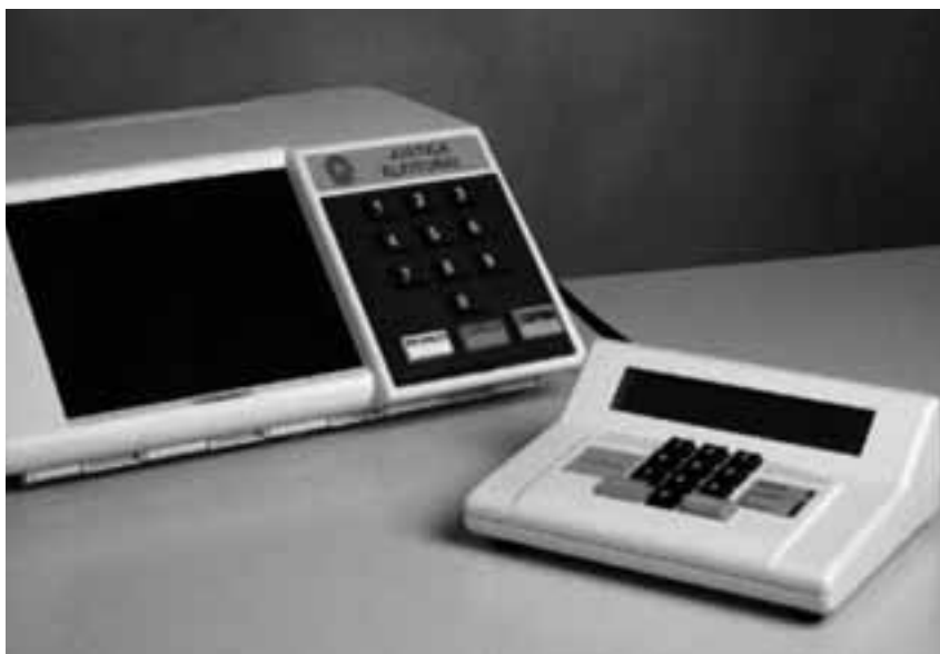
Figura 1: A Urna Eletrônica e a unidade de comando do mesário.

Os desafios tecnológicos estavam não no estabelecimento das funcionalidades, efetivamente já fixadas no edital de aquisição, mas no projeto eletromecânico para assegurar o custo possível, a robustez necessária para a diversidade de ambientes, a confiabilidade exigida e a autonomia de operação em localidades sem energia elétrica. Outro desafio tecnológico superado foi a orientação às empresas fornecedoras de partes e peças e às montadoras de equipamentos, no sentido de assegurarem o atendimento às rigorosas exigências de operação/confiabilidade em campo, também elemento decisivo para o êxito da eleição eletrônica. Modernos conceitos de garantia da qualidade foram aplicados. (Mais detalhes em: http://www.certi.org.br/mod_Base/soluc_urna_oproj.php4 )