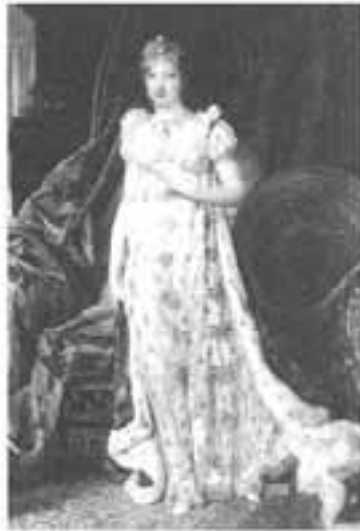
Maria Luísa, irmã de Leopoldina e esposa de Napoleão Bonaparte.