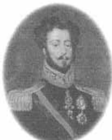
Dom Pedro I.