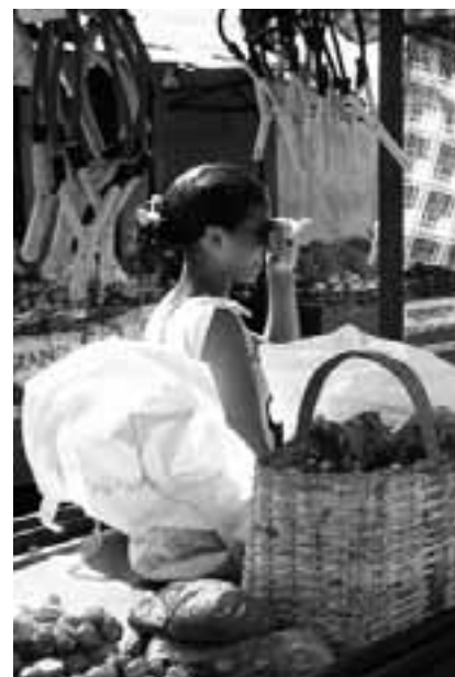
Teilnehmerin des Fotoprojekts

Die Internationale Begegnungsstätte in Bonn (Quantiusstr. 9, Nähe Hauptbahnhof) ist die erste Station der Wanderausstellung, wo die Werke der Jugendlichen vom 24.6 bis 24.7.2009 für alle Interessierten zu sehen sind. ■