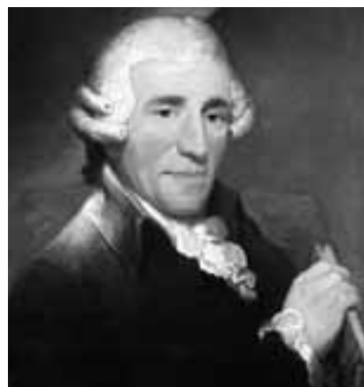
Joseph Haydn 1791, Ölgemälde von Thomas Hardy

Es handelt sich um ein Memorandum von Joachim Le Breton (1760-1819), einen Vortrag, den er 1810 in Paris im 1795 gegründeten Institut de France , dessen Mitglied er war, gehalten hatte. 1816 war Le Breton nach Rio de Janeiro als Leiter der französischen Kommission ( Missão Artística Francesa ) gekommen, die der kolonialen Stadt auf allen künstlerischen Gebieten ein neues, modernes Image geben sollte, bevor die Gattin des künftigen Königs, Erzherzogin Leopoldine, 1817 in Rio eintreffen würde. Es sollte vor allem eine Escola Real de Ciências, Artes e Ofícios gegründet werden, heute Escola de Belas Artes