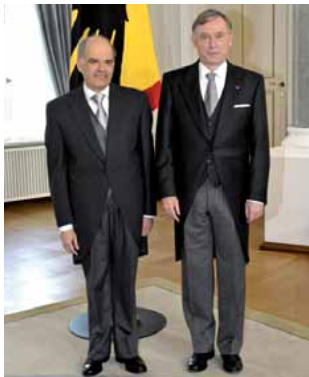
Everton Vieira Vargas na entrega das cartas credenciais ao presidente alemão Horst Köhler

O Brasil não orienta suas ações por preconceitos e procura o diálogo com todos os países e regiões. Priorizamos a América do Sul e sua integração com cujos países somos um interlocutor ativo e solidário. Daí a importância do fortalecimento do Mercosul e da celebração do Tratado da UNASUL. Nossas relações com África e os países árabes são respaldadas pela herança étnica e cultural. Há novas oportunidades nas relações com a China, a Rússia e a África do Sul. Temos diálogo franco e construtivo com os Estados Unidos, onde hoje empresas brasileiras têm investimentos substanciais. A parceria estratégica com a União Europeia revitaliza uma relação histórica.