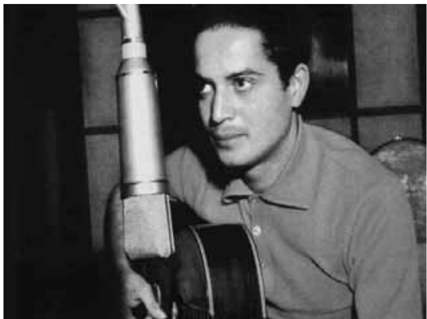
Der Gitarrist, Komponist und Sänger Baden Powell komponierte einige der langlebigsten Samba- und Bossa-Nova-Evergreens und nahm mehrere Platten mit dem deutschen Jazzautor Joachim Ernst Berendt auf.

Zu den wichtigsten Sambistas zählen Pioniere wie Donga, João da Baiana und Pixinguinha, einer der wichtigsten Musiker des Landes.