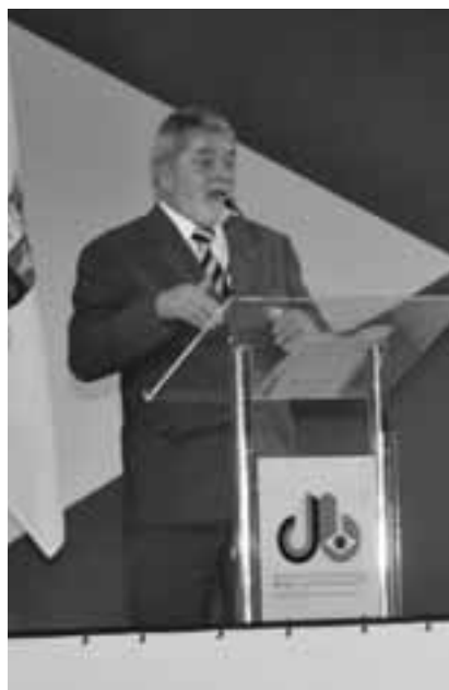
Präsident Lula auf der Abschlussitzung

Dies trifft für Espírito Santo umso mehr zu, als vor seiner Küste bedeutende Erdöl-Lagerstätten entdeckt