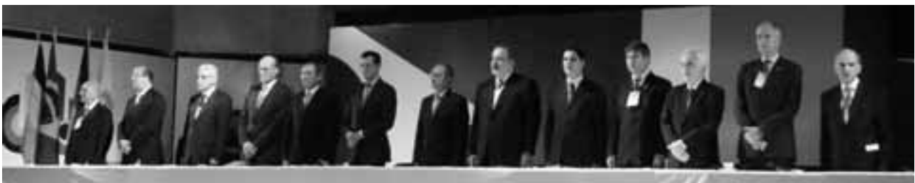
Eröffnung der Wirtschaftstage am 30. August 2009

Der Erfolg von Vitória hat „die Latte hochgelegt“ – aber vielleicht könnte München mit einem sportlichen Ereignis punkten: Einem Länderspiel der Fußball-Damen. Vamos ver! ■