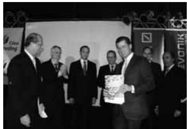
Vorstellung der „Roadmap Brasilien“