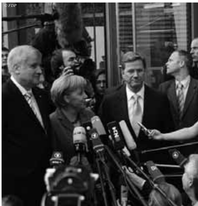
Horst Seehofer (CSU), Angela Merkel (CDU) e Guido Westerwelle (Partido Liberal) no foco da imprensa após a eleição