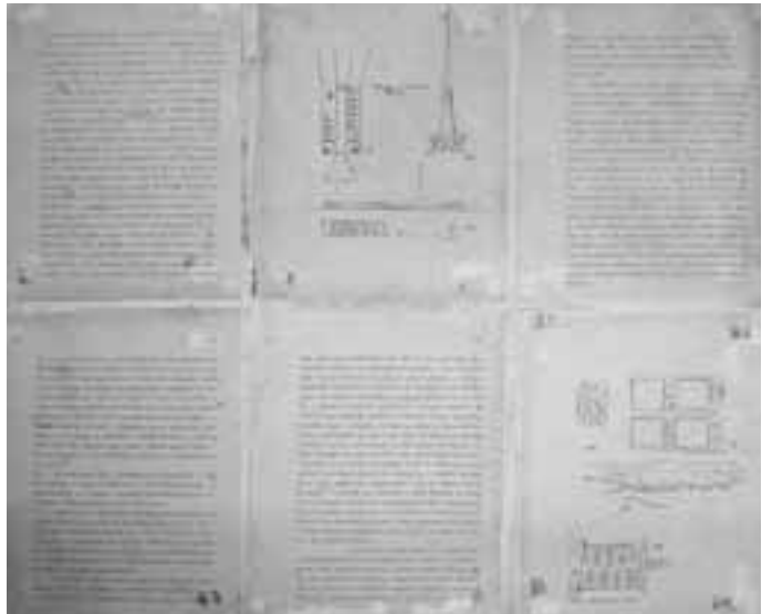
Brasília. Masterplan Plano Piloto, 1957, Tafel 4 Bildnachweis: Lucio Costa © by Casa de Lucio Costa, Rio de Janeiro

Die Monumentalachse ist nicht einfach nur monumental: Je näher man den über viele Kilometer in den Blick gerückten Parlamentsbauten kommt, desto kleiner und angenehmer im Maßstab werden sie, bis man zum Schluss einfach die Rampe hinauf und zur Tür hinein geht. Hier entsteht genau der gegenteilige Effekt einer barocken Monumentalachse, bei der der Zielpunkt sich zunehmend vor einem auftürmt, soziale Distanz erzeugend. Umgekehrt wird hier Distanz abgebaut. Früher konnten Kinder sogar auf dem Dach des Parlaments herumrutschen, so hat mir Gabriela aus Brasília erzählt. Sie ist, nachdem sie in München Architektur studiert hat, zurück in ihre Heimatstadt gezogen, die sie liebt.