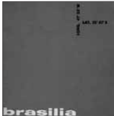
Max Gruenwald & Cia. (ed.), Brasília. Acropole 256/257. São Paulo-Brasil 1960 / 1970 Carmen Stephan, Brasília stories. München 2005