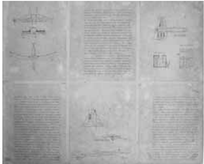
Brasília. Masterplan Plano Piloto, 1957, Tafel 3 Bildnachweis: Lucio Costa © by Casa de Lucio Costa, Rio de Janeiro

In den 60er Jahren des 20. Jahrhunderts setzte eine massive Kritik an der architektonischen und urbanistischen Moderne ein. Brasília wurde nicht verschont, zeigte die Stadt doch alle typischen Merkmale und Eigenschaften eines modernistischen Städtebaus: Die funktionalistische Trennung in unterschiedliche Lebensbereiche – Wohnen in den Superquadras, Arbeiten im Zentrum oder im Regierungsviertel, Erholen in ausgewiesenen Parks oder am See, Verkehr wiederum