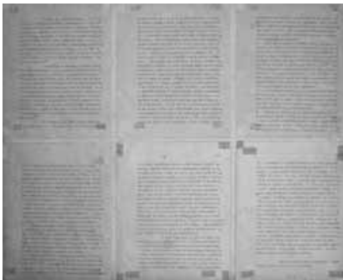
Brasília. Masterplan Plano Piloto, 1957, Tafel 5 Bildnachweis: Lucio Costa © by Casa de Lucio Costa, Rio de Janeiro

Kann eine Stadt ein Weltkulturerbe sein? Muss sie nicht, um lebendig zu bleiben, sich ständig verändern, den neuen sozialen und wirtschaftlichen Verhältnissen gerecht werden können? Wie weit kann man einen Stadtgrundriss einfrieren? Was sind die essentiellen Bestandteile neben den berühmten Gebäuden des Regierungsbezirks, Universität, Präsidentenpalast? Ist der plano piloto unantastbar bis in das Konzept der auf Pilotis stehenden Wohnhäuser hinein? Oder ist es doch nur die große Figur und einzelne zu bewahrende Monumente, die es zu bewahren gilt, während sich die einzelnen Superquadras zeitgenössischen Bedürfnissen andienen könnten. Kann man die alten Superquadras nachverdichten, um die soziale Infrastruktur zu bedienen, da heute nur halb so viele Menschen die Häuser bewohnen, wie es ursprünglich geplant war? Mit all diesen Fragen schlagen sich die Stadtplaner Brasília heute herum. Sie sind nicht einer Meinung. Brasília ist im Alltag der Städte angekommen. ■