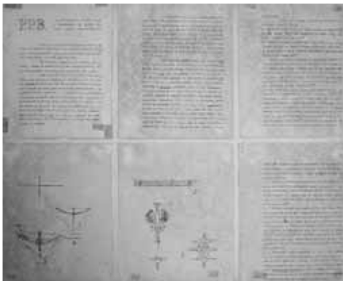
Brasília. Masterplan Plano Piloto, 1957, Tafel 2 Bildnachweis: Lucio Costa © by Casa de Lucio Costa, Rio de Janeiro

Kreuzungspunkt liegen Handel, Busbahnhof, City. Die originalen Wettbewerbstafeln konnten wir im Winter 2009 im Architekturmuseum der TU München in der Pinakothek der Moderne in der Ausstellung multiple city zeigen. Zum ersten Male überhaupt waren sie ausgestellt. Äußerst sparsam in der Darstellung, wenn man es mit heutigen Wettbewerbsgepflogenheiten vergleicht, beinhalten sie doch skizzenhaft und thesenhaft in essentieller Verdichtung alle wesentlichen Entwurfs-elemente.